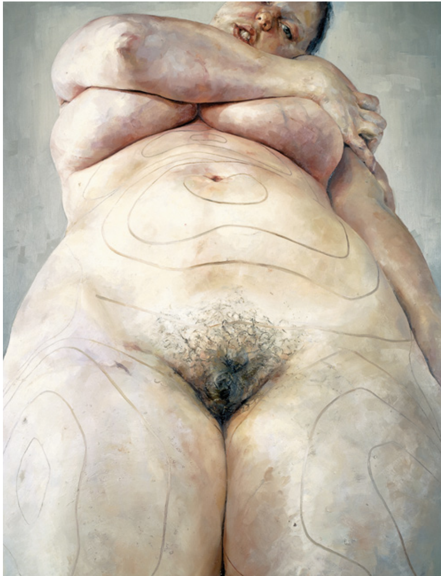
Plan 1993 Oil on canvas 274 x 213.5 cm