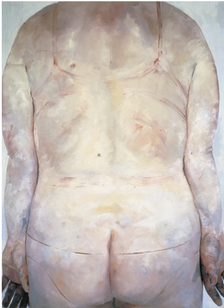
Trace 1993-94 Oil on canvas 213.5 x 165 cm