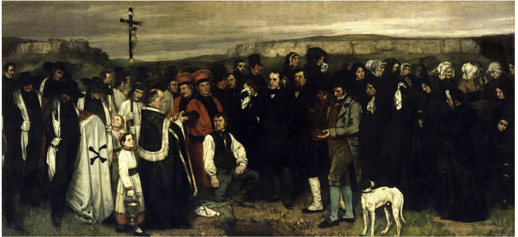
A funeral at Ornans by Gustave Courbet 1849