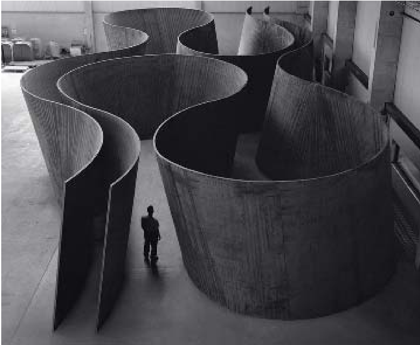
RICHARD SERRA, inside out , 2013 weatherproof steel 401.3x 2,494.3x1,222.6 cm