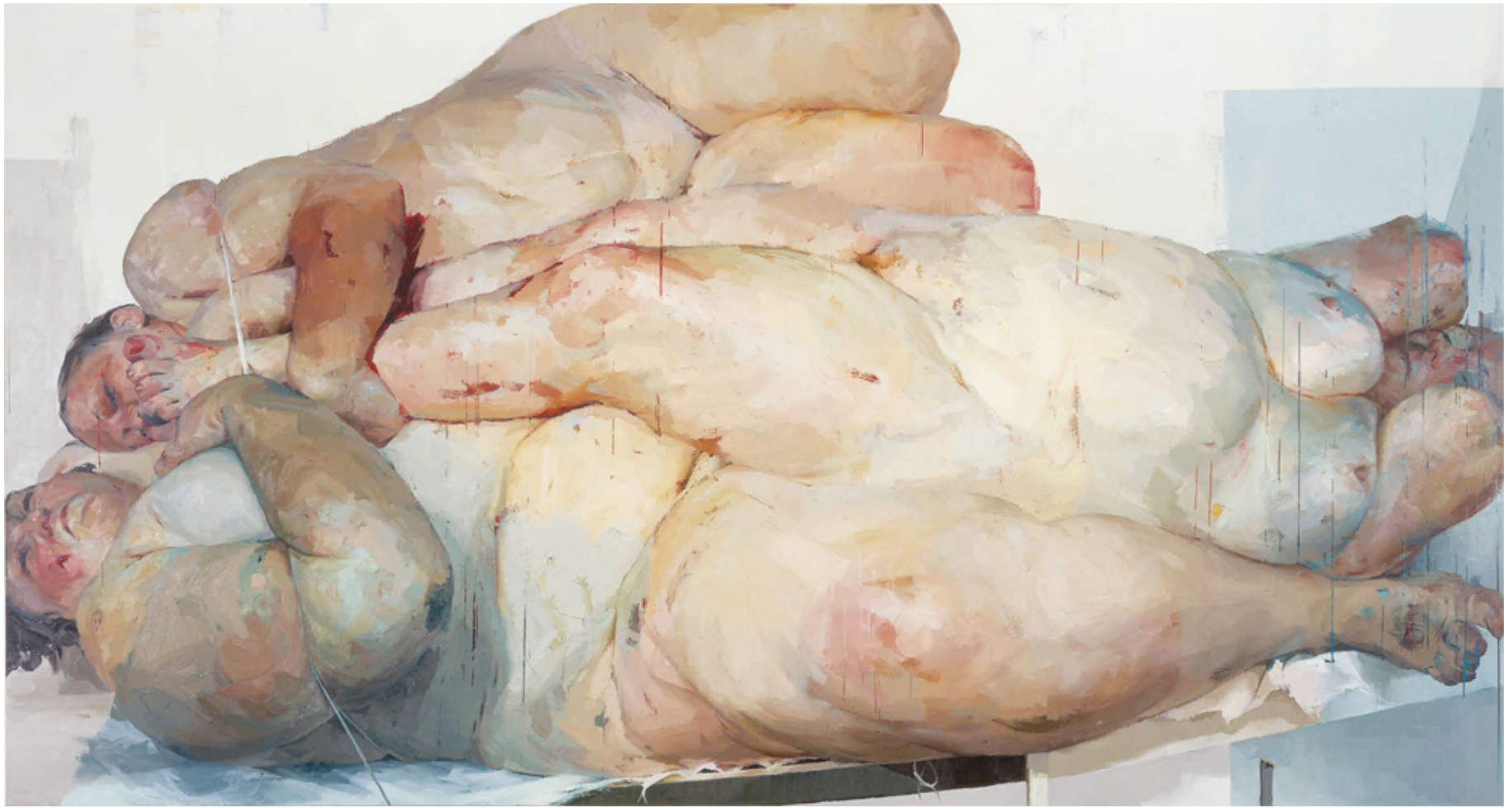
Fulcrum 1999 Oil on canvas 261.6 x 487.7 cm