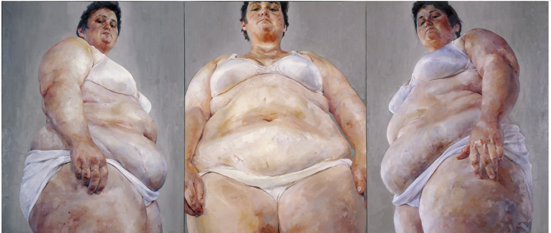
Strategy (South Face, Front Face, North Face) 1993-94 Oil on canvas (triptych) 274 x 640 cm