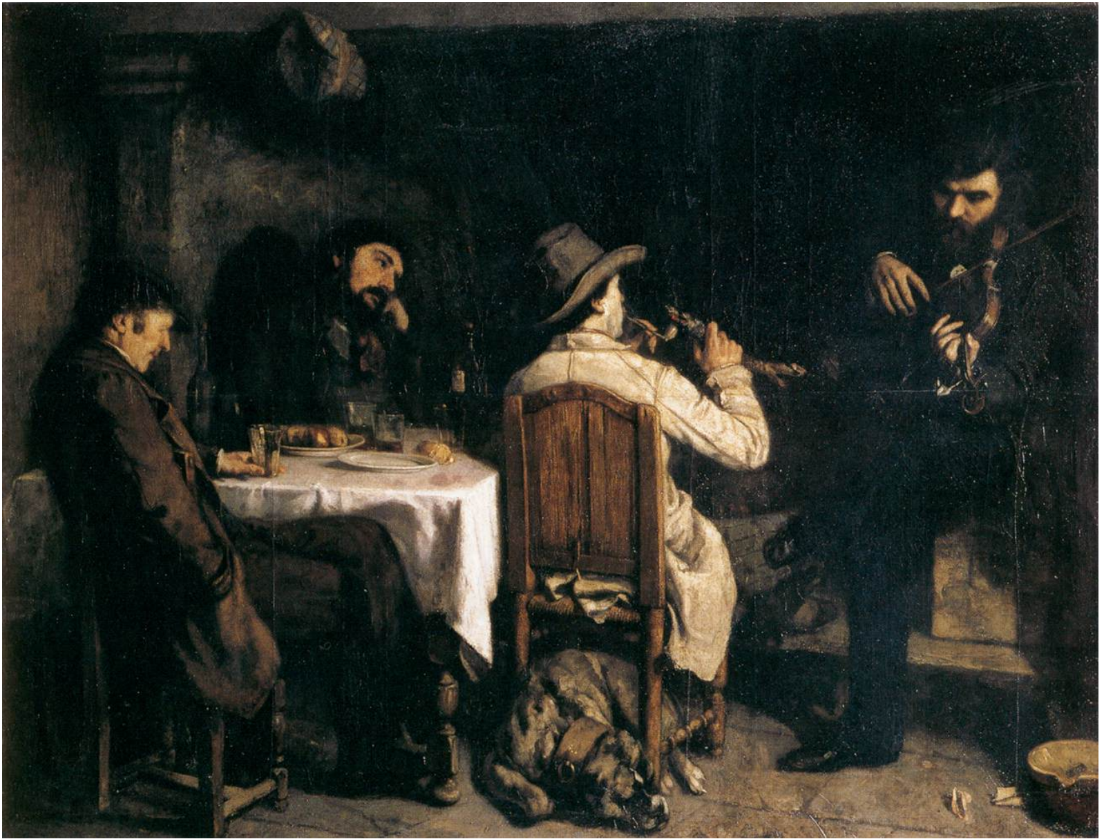
After dinner at Ornans by Gustave Courbet 1848-9