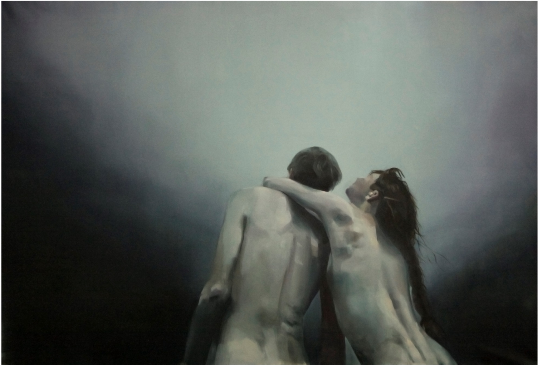
Until the end, oil on canvas, 288 x 195 cm, Nicolas Paradiselo, 2013